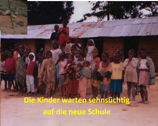
Die Kinder warten sehnsüchtig auf die neue Schule