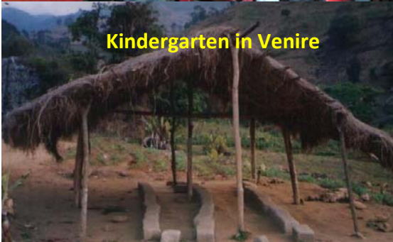
Kindergarten in Venire