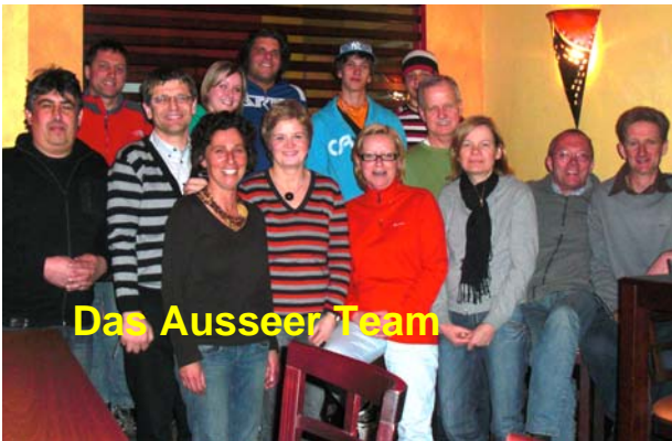
Das Ausseer Team