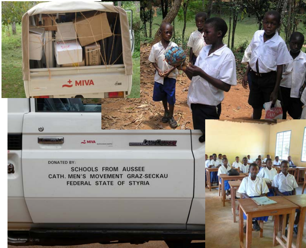
Fußball bestehend aus Plastikmüll